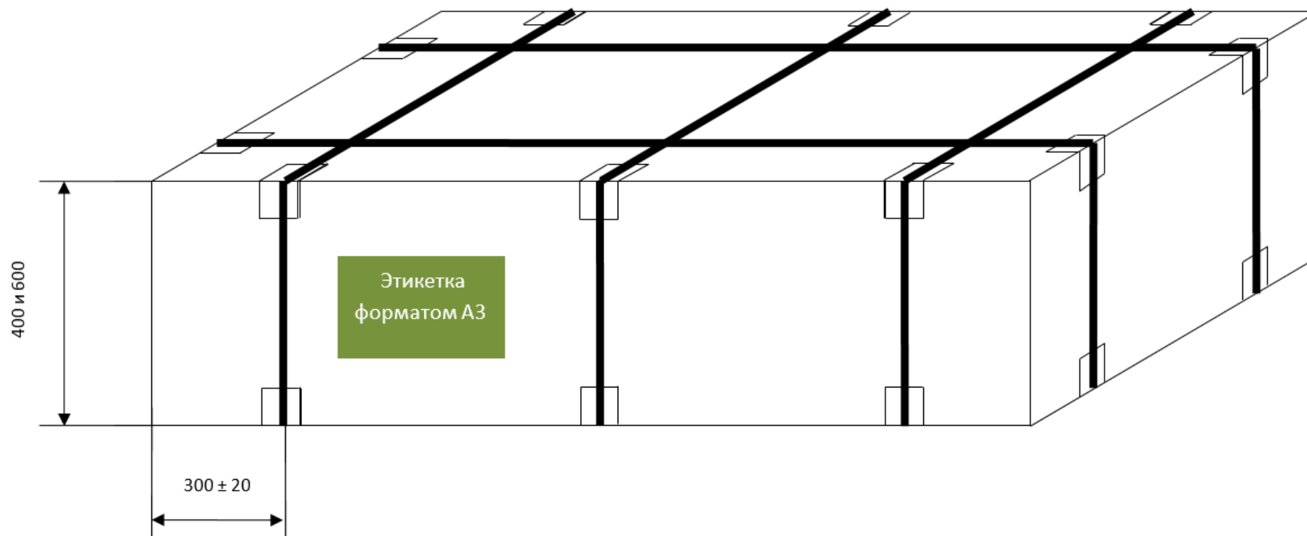
Схема упаковки фанеры SVEZA TOY форматом 2500 (2440) x 1250 (1220) x 2500 (1250) мм в пачки высотой 400 и 600 мм